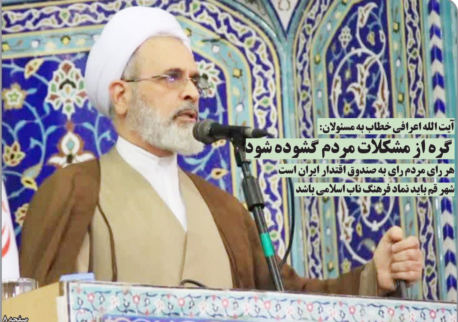
آیت‌الله اعرافی خطاب به مسئولان: