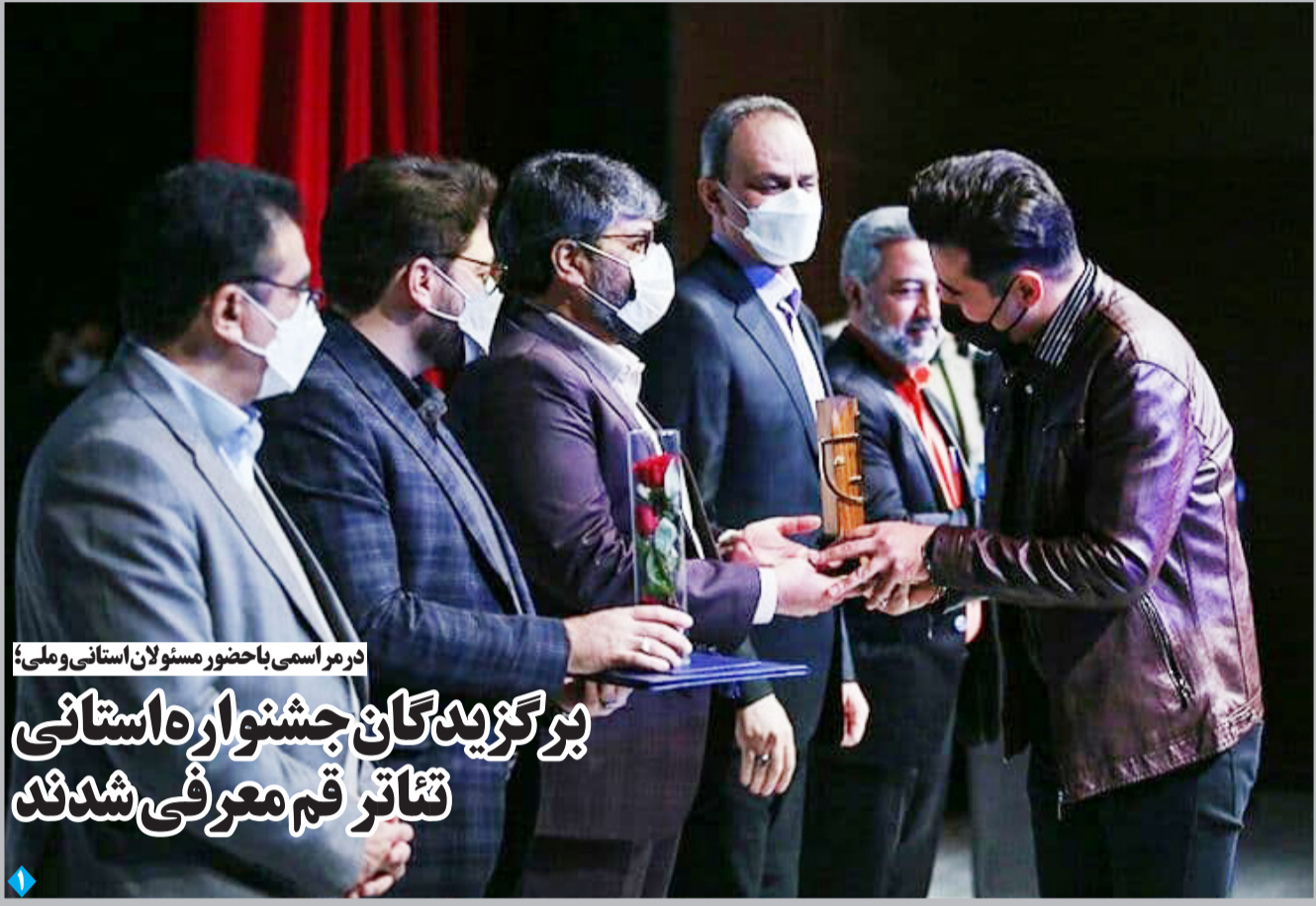
در مراسم با حضور مسئولان استانی و ملی؛

معاون اقتصادی رئیس جمهور گفت: در بازاری که رانت انحصار و مفسد باشد نمی‌توان قیمت واقعی را تعیین کرد. محسن رضایی روز شنبه در همایش بیمه و توسعه با اشاره به اینکه اصلاح بازارها از جمله بازار بیمه یک مسئله کلیدی است افزود: اگر بازارها اصلاح نشوند قیمت‌های