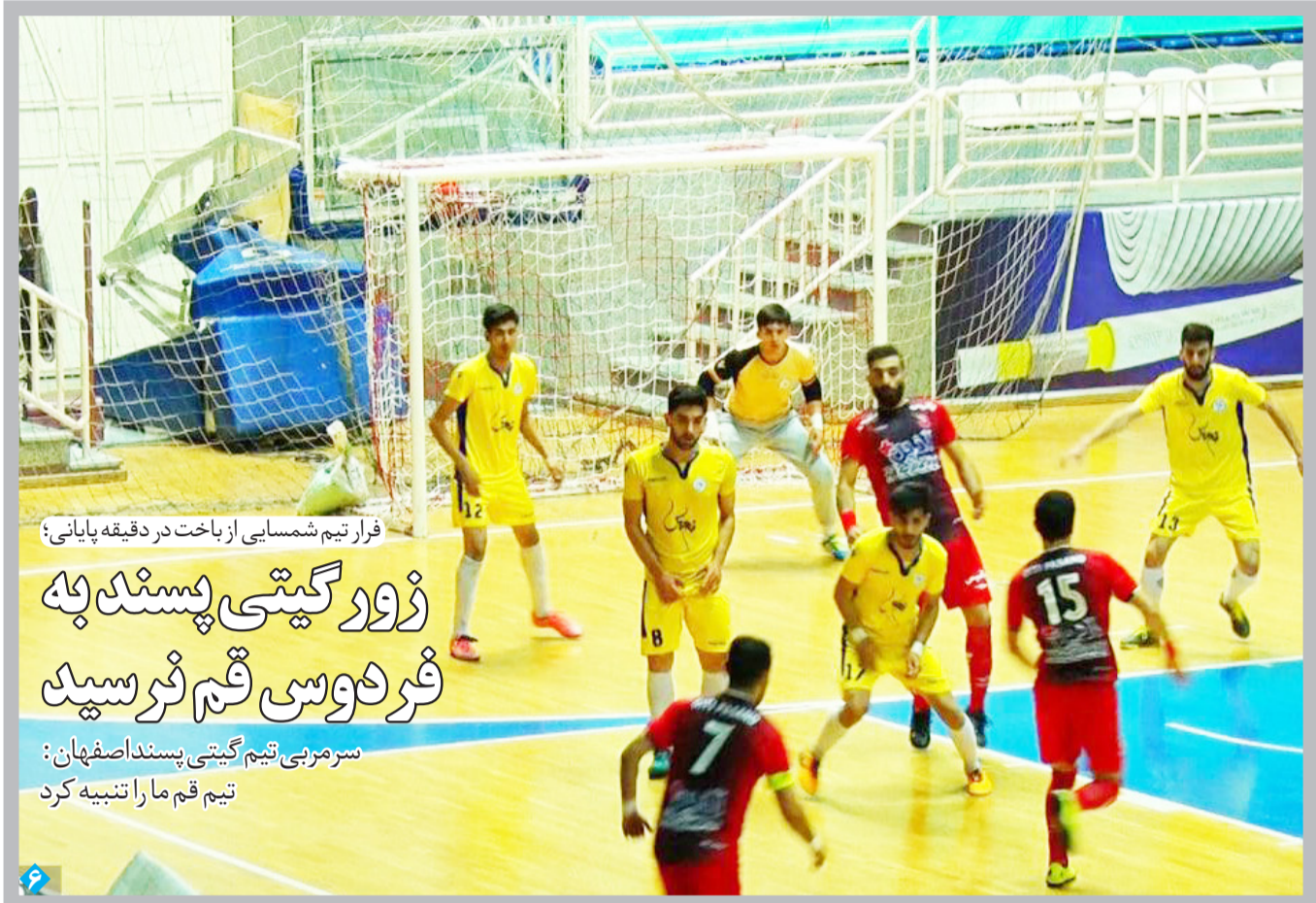
قرار تیم شمسایی از باخت در دقیقه پایانی؛