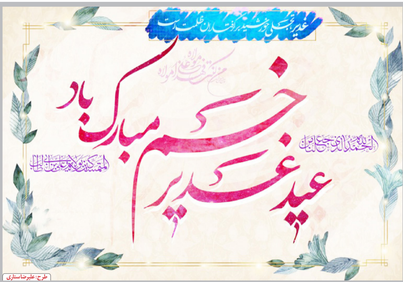
طرح: علیرضا ستاری

رئیس کمیسیون عمران و حمل‌ونقل شورای اسلامی شهر قم تأکید کرد: ضرورت نگاه شبکه‌ای در توسعه معابر شهری