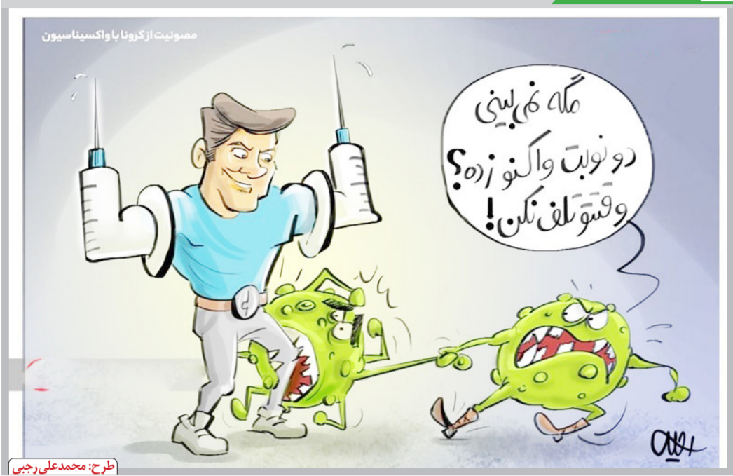
طرح: محمدعلی رجایی