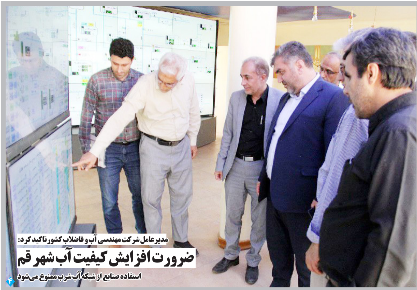
مدیرعامل شرکت مهندسی آب و فاضلاب کشور تاکید کرد: