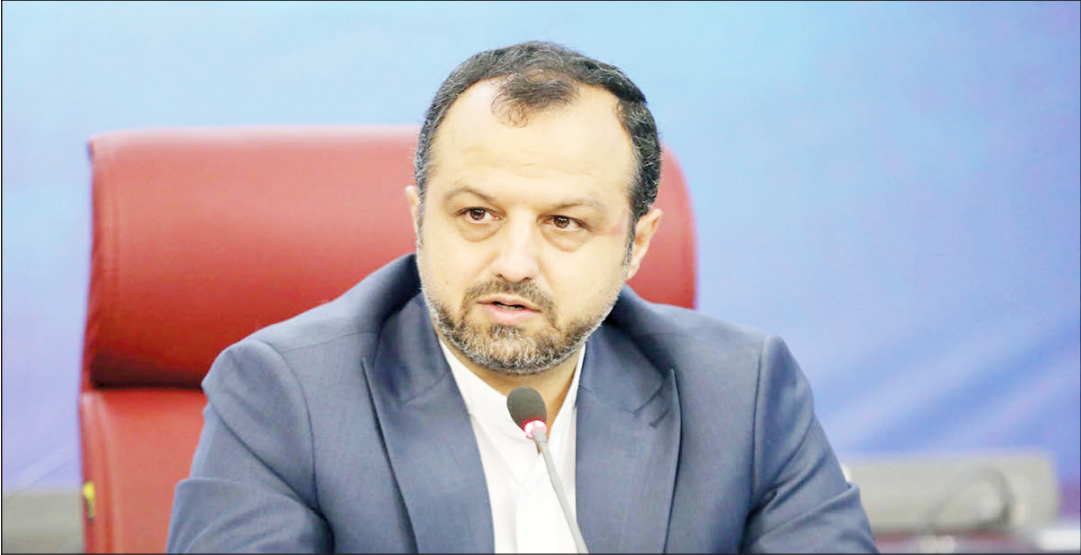
وزیر امور اقتصادی و دارایی، علی‌رضا زاهدی، در جریان دیدار با نمایندگان مجلس شورای اسلامی

وزیر اقتصاد گفت: مسئله بعد، افزایش سهم اعتبارات خریدی است که بتواند مبتنی بر «اعتبارسنجی» به مردم و طبقه متوسط و پایین‌دست جامعه پرداخت شود که تا کنون دسترسی کمتری به‌منابع داشته‌اند.