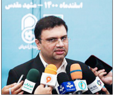
حفظ اسکوچیچ در تیم ملی

فوتبال و در حوزه فعالیت ما در هیئت رئیسه فدراسیون هم وجود دارد. اتفاقا همین اختلاف نظر می تواند یک عامل موثر و کمک کننده باشد برای بهتر تصمیم گرفتن و تصمیمات را بر مبنای کار کارشناسی و چکش کاری گرفتن. وی افزود: در حوزه های مختلف نظرات مختلف وجود دارد، اما آن چیزی که در بین ما میثاق هست و جمع اعضای هیئت رئیسه بر آن اعتقاد دارند، این است که به رای جمع و خرد جمعی تمکین کنیم و همراهی لازم را داشته باشیم، هر چند نظر متفاوت با دوستان داشته باشیم. فضای مجمع مبنی بر تأیید تصمیم هیئت رئیسه فدراسیون است سخنگوی هیئت رئیسه فدراسیون فوتبال در خصوص ادامه کار عزیز یی خادم گفت: در اساننامه فدراسیون آن چیزی که به ما اختیار داده، عزل موقت است و تصمیم نهایی را مجمع می گیرد. بر اساس برآوردها و تماس ها و گفتگوهایی که ما با اعضای مجمع داشتیم، فضای مجمع مبنی بر تأیید تصمیم هیئت رئیسه فدراسیون است. تحلیل و برداشت من این است که این تصمیم هیئت رئیسه در مجمع عمومی فدراسیون به تأیید خواهد رسید. وی درباره اساننامه فدراسیون گفت: موضوع اساننامه در دستور این جلسه نبود. اما در خصوص اساننامه آتی براتی توضیح کامل و با جزئیات خواهند داد. در مکاتباتی که با فیفا انجام شده، در خواست زمان کرده ایم و خواستیم مهلتی داده شود تا هم در مجلس این موضوع را پیگیری کنیم و هم در فیفا، منتظر پاسخ هستیم اما با ایزنی هایی