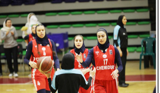
تیم بسکتبال بانوان شیمیدر قم در بازی نخست از فینال لیگ برتر با نتیجه ۷۰ بر ۵۹ مغلوب گروه بهمن تهران شد.

به گزارش روز پنجشنبه هیات بسکتبال قم، شیمیدر قم در بازی نخست برابر گروه بهمن نتیجه را واگذار کرد اما با توجه به ۴ بازی باقی مانده هنوز برای مشخص شدن تکلیف قهرمانی راه درازی وجود دارد. شیمیدر قم و گروه بهمن تهران در مسابقه نهایی فصل ۱۴۰۰-۱۴۰۱ لیگ برتر بسکتبال زنان ایران به شکل ۵۳ تا ۴۵ برای به دست آوردن رتبه نخست و جام قهرمانی این دوره از بازی ها رو در روی یکدیگر قرار می گیرند. طبق اعلام فدراسیون بسکتبال کشور، این دو تیم در فینال مسابقات اسفال طی روزهای ۱۹ تا ۲۵ اسفندماه جاری به مصاف هم خواهند رفت تا قهرمان فصل جاری لیگ برتر بانوان ایران مشخص شود. این دو تیم در بازی های بعدی از ساعت ۱۵ و ۳۰ دقیقه روزهای ۲۱، ۲۳ و ۲۵ اسفندماه جاری با یکدیگر به رقابت خواهند پرداخت. بازی های شیمیدر و گروه بهمن در فینال این فصل لیگ برتر بانوان در تالار بسکتبال آزادی تهران برگزار می شود و در صورت نیاز به بازی پنجم، این دیدار روز جمعه ۲۷ اسفندماه به انجام خواهد رسید تا تیم قهرمان لیگ برتر بانوان مشخص شود. شیمیدر قم و گروه بهمن پیش از این در مقدماتی لیگ برتر هم گروه بودند که نشانگران شایسته مشترعی در شیمیدر موفق شدند حریف خود را در هر ۲ دیدار رفت و برگشت شکست دهند و با تداوم پیروزی های خود تنها تیم بدون باخت مسابقات این فصل لقب گرفته اند.