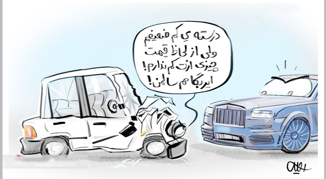
آیا شان یک ایرانی ازابه مرگ ۱۸۰ میلیون تومانی است ؟ ۱ نکارتهمدی خودروسازان داخلی بلای جان ملت شده است. آیا شان خانواده شریف ایرانی استفاده از خودرو با قیمت بالغ بر ۱۸۰ میلیون تومان است که از آن با نام ازابه مرگ یاد می‌شود؟ خودروسازان به واسطه حمایت‌های بی‌ضابطه، تضادات رنج‌بخیزه‌ای را می‌بندد و شانه از مسئولیت جانی می‌کند. راه حل این موضوع خصوصی‌سازی واقعی و اجازه واردات خودروهای با کیفیت و با تعرفه‌های منصفانه است.