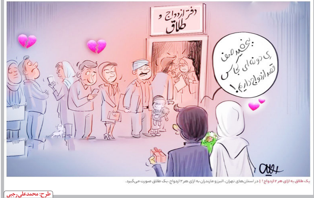
یک طلاق به ازای هر ۱۲ ازدواج! در استان‌های تهران، البرز و مازندران به هر ۱۲ ازدواج، یک طلاق صورت می‌گیرد.