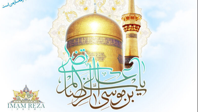
این تصویر تابلو، بل یوم بزرگداشت نهمین است یاد رضا زهمین سالزم است

ابوالحسن علی بن موسی الرضا (ع) بنابر نقل‌های تاریخی در ۱۱ ذیحده ۱۴۸ هجری دیده به جهان گشود. کنیه این امام همام ابوالحسن عنان شده و چون حضرت علی (ع) نیز به این لقب خوانده می‌شود، ایشان به ابوالحسن ثانی مشهور است. تاریخ نگاران این طور نوشتند که مدت امامت امام رضا (ع) ۲۰ سال بوده که ۱۰ سال آن معاصر با خلافت هارون الرشید، پنج سال معاصر با خلافت محمدامین و پنج سال آخرین‌هم عصر با خلافت عبدالله مأمون بود. امام (ع) نا آغاز خلافت مأمون در زادگاه خود در شهر مدینه اقامت داشت اما مأمون پس از رسیدن به حکومت، ایشان را به خراسان فرا خواند و امام رضا (ع) سال‌های پایان عمر خویش را در خراسان سپری کردند. هم‌پزین نکنه و عنوانی که در زندگی ائمه (ع)، به‌طور کافی و وافق مورد توجه قرار نگرفته، عنصر «مبارزه مستمر سیاسی» است. از آغاز نیمه دوم