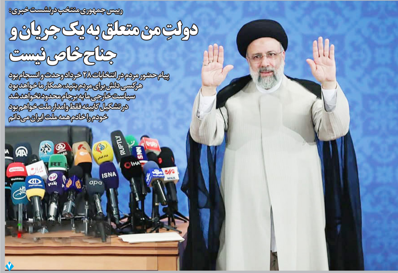
رئیس جمهوری منتخب در نشست خبری: دولت من متعلق به یک جریان و جناح خاص نیست

پیام حضور مردم در انتخابات ۲۸ خرداد وحدت و انسجام بود هرکسی دلش برای مردم پشه همکار ما خواهد بود سیاست خارجی ما به پرچام محدود نخواهد شد در تشکیل کابینه فقط اولمدار ملت خواهیم بود خودم را خادم همه ملت ایران می دانم