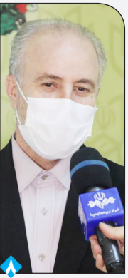
فرماندار شهرستان قم: