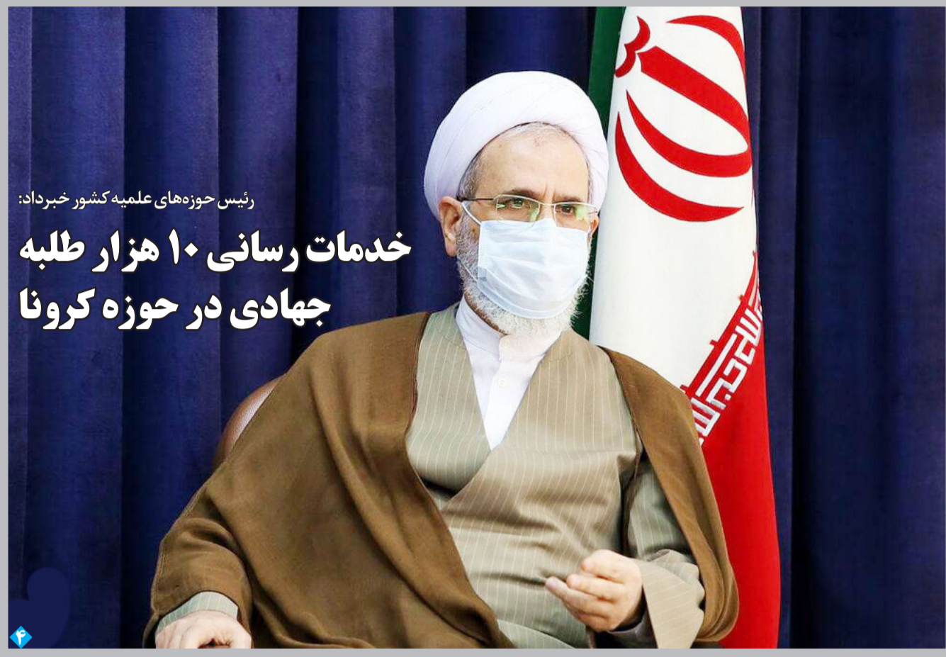
رئیس حوزه های علمیه کشور خبر داد: