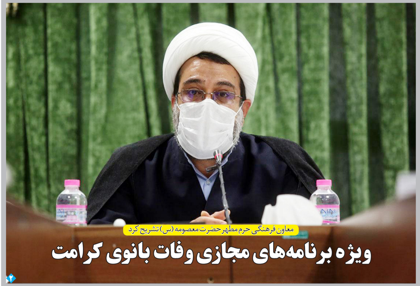
معاون فرهنگی حرم مطهر حضرت معصومه (س) تشریح کرد