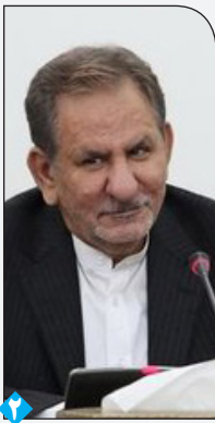
معاون اول رئیس جمهوری:

معرفی ۲۴۵ نفر به دستگاه قضایی در باره سیل