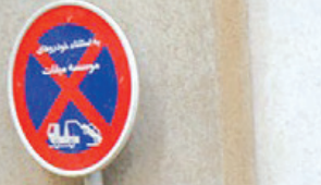
فرمانده نیروی انتظامی در قم: