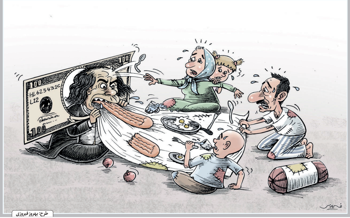
طرح: بهروز فیروزی