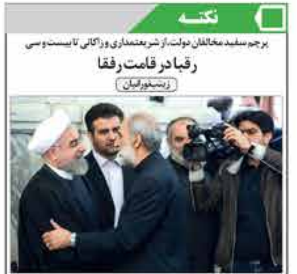
برجم سفید مخالفان دولت را در شریعتمداری و راکانی تأیید می‌کند