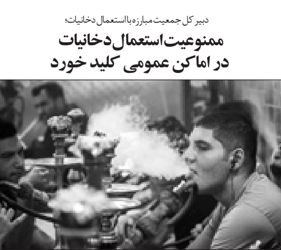
دبیر کل جمعیت مبارزه با استعمال دخانیات؛