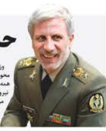
امیر حاتمی تاکید کرد