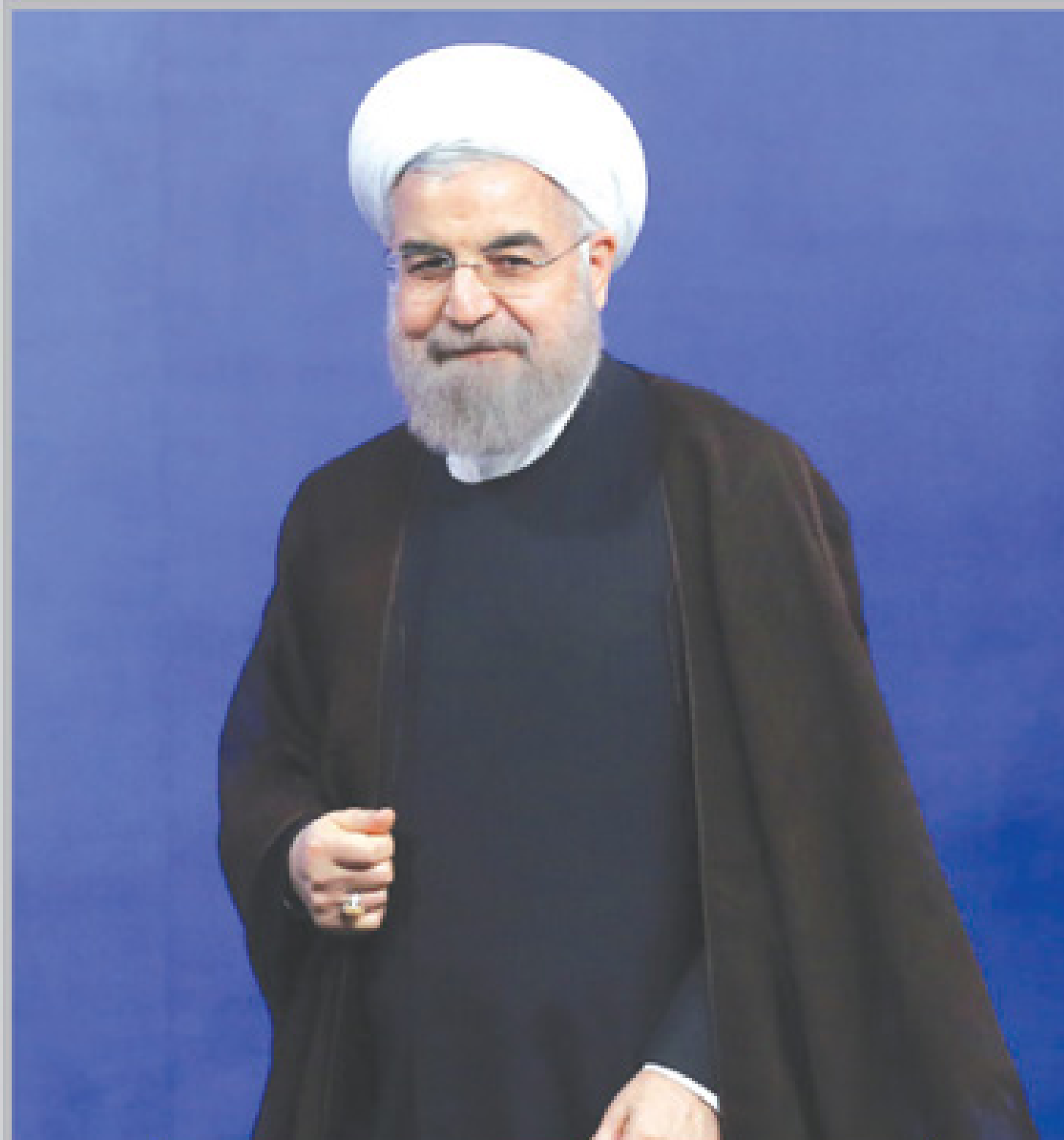
از افشای پرونده قالیباف تا دادگاه روحانیت به ریاست رئیسی