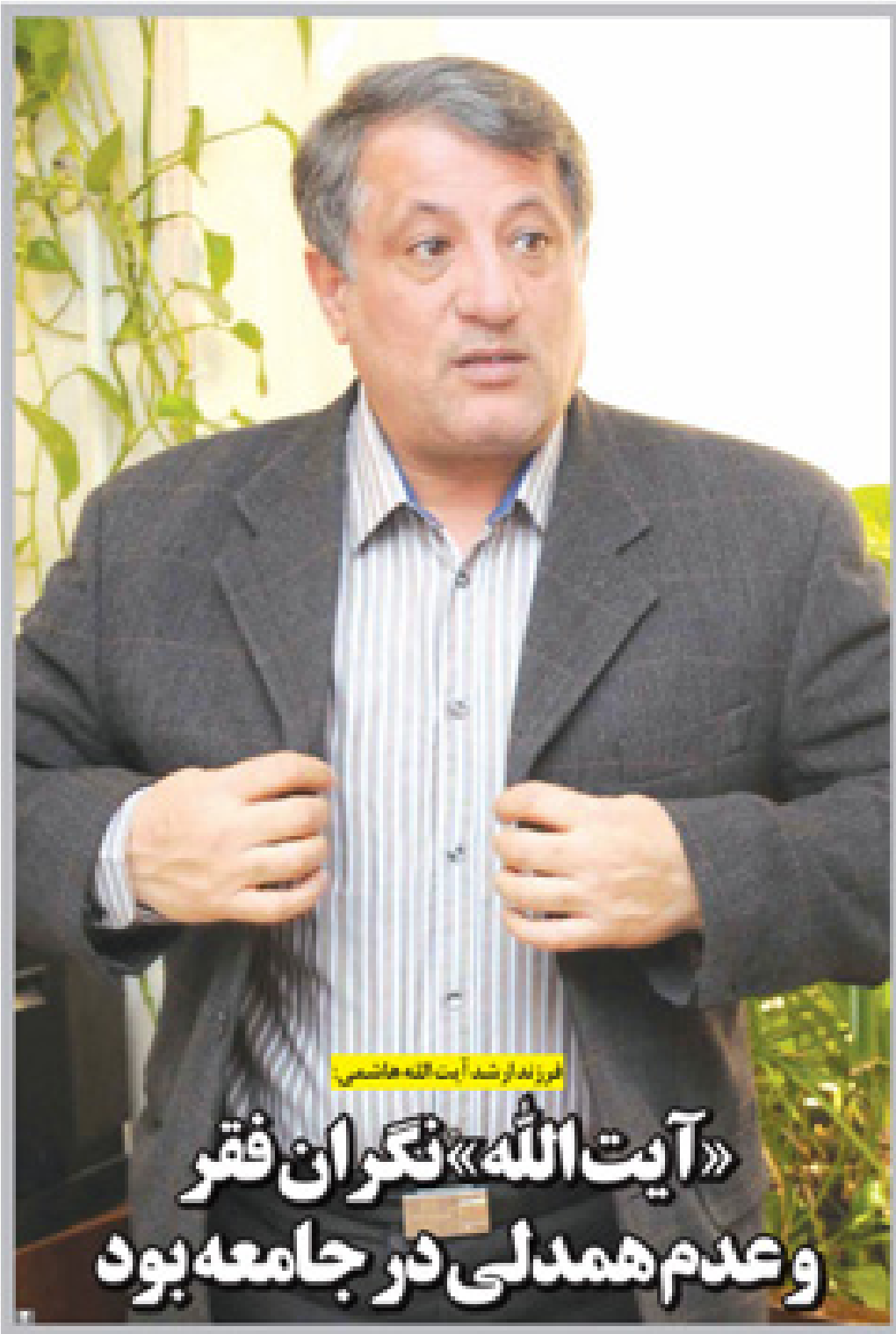
مرزها در آیت الله هاشمی

افزایش ۴۰ درصدی گرایه تاکسی در قم تکذیب شد