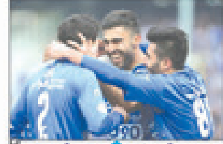
رئیس شورای اسلامی شهر قزوین