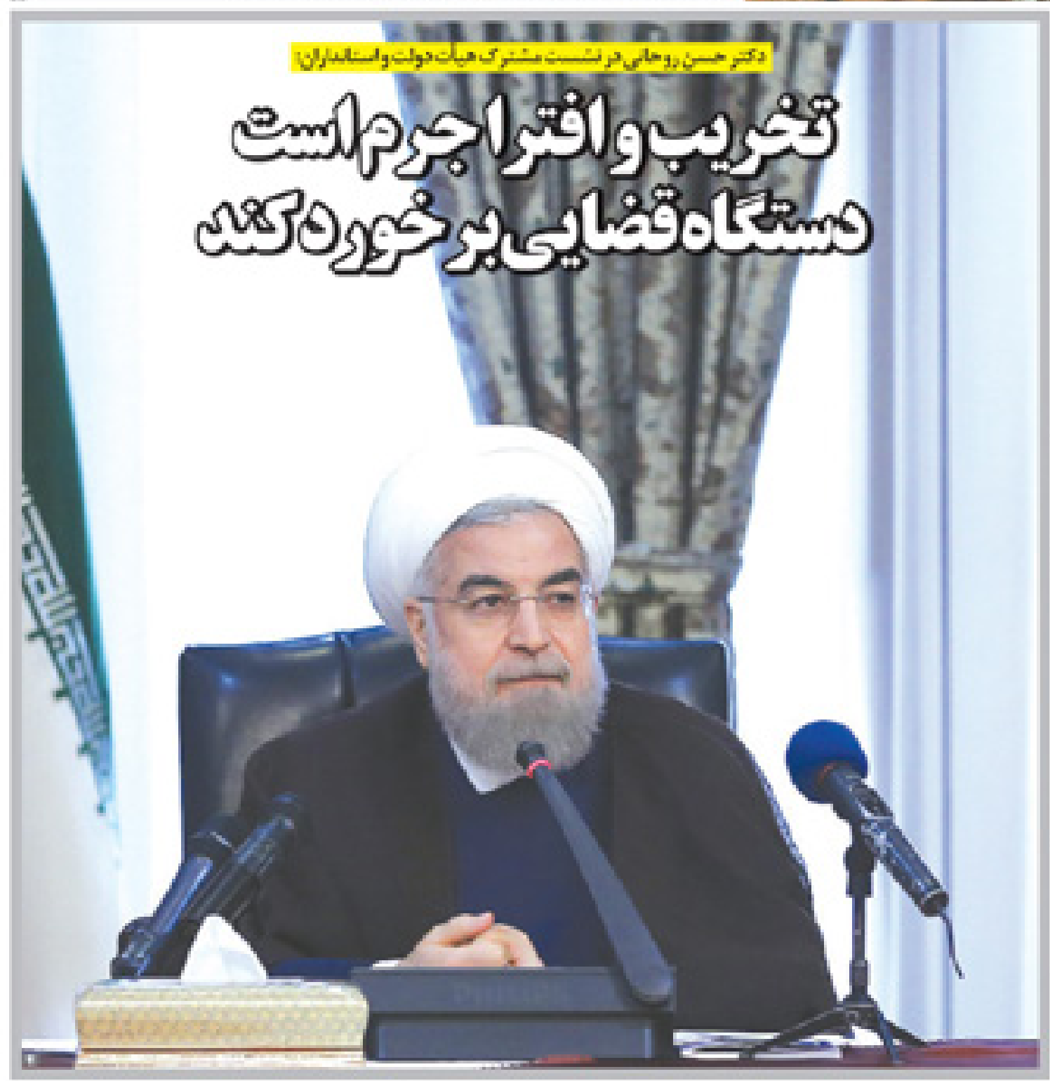
دکتر حسین روحانی در نشست مشترک هیات دولت و استانداران

نقشه احمدی‌نژاد برای انتخابات ریاست جمهوری سال ۹۶ رویای دو قطبی سازی برای باز گشت حمید احمدی‌نژاد که فعالیت می‌کند، خواهان دو قطبی سازی است. او می‌خواهد تا آنجا که می‌تواند، دو قطبی سازی را در کشور ایجاد کند. او می‌خواهد تا آنجا که می‌تواند، دو قطبی سازی را در کشور ایجاد کند. او می‌خواهد تا آنجا که می‌تواند، دو قطبی سازی را در کشور ایجاد کند.