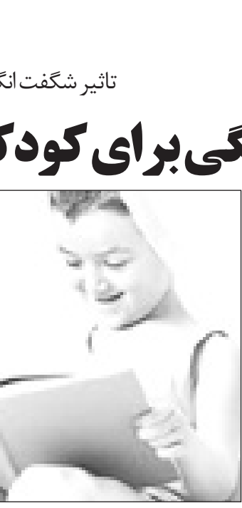
می توانداالگوپذیری کنند.

وی ضمن اشاره به اهمیت داستان در الگوپذیری کودک اظهار می کند: داستان یکی از روش هایی است که از طریق آن می توان بر شخصیت کودک اثر گذاشت.کودکان از سنین خاصی به بعد باکمالات خیال پردازی می شوند ودر مجموع از دوسالگی قادر به جایگزینی خود با شخصیت داستان هستند و