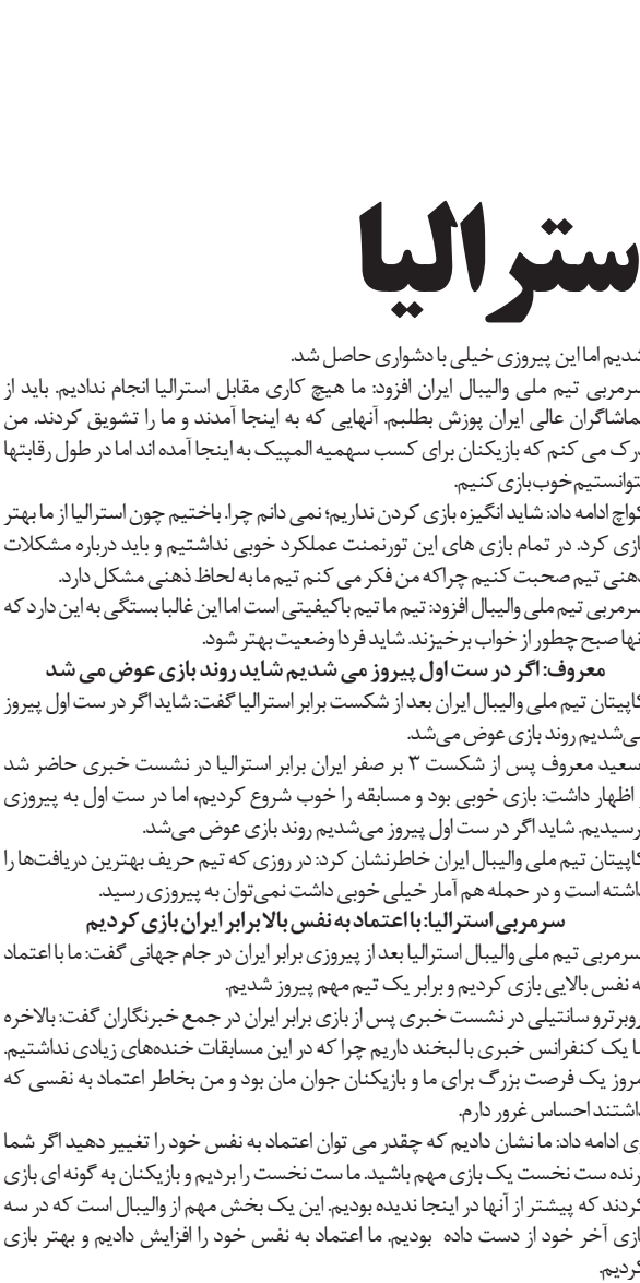
کواچ در جریان بازی با استرالیا

سرمربی تیم ملی استرالیا ادامه داد: امروز برای ما یک گام بزرگ بود زیرا ما فقط بازی نکردیم بلکه خوب بازی کردیم و یک تیم مهم را شکست دادیم. بیشتر بازیکنان تیم ما جوان هستند و این یک گام بزرگ برای آنها بود چرا که بیشتر آنها برای اولین بار است که چنین تورنمنتی طول این رقابت‌ها تجربه‌ای یاد گرفتیم و تیم ما بهتر بازی می‌کند.