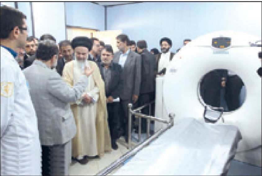
امیر آبدی نماینده قم در مراسم افتتاح بیمارستان امام رضا(ع)

نماینده قم در مجلس شورای اسلامی نیز در این مراسم با اشاره به اینکه نقطه یابی و مکان احداث بیمارستان از ابتدا مناسب نبود، گفت: باید همه مسوولان برای هر چه بهتر شدن مسیرهای دسترسی به این بیمارستان وقت و آمد مردم تلاش کنند. احمد امیر آبدی فراهانی با بیان اینکه در این استان مراکز درمانی نسبت به جمعیت بیمه شده هنوز با کمبود مواجه است، شک اگر بیمه کار کرد مناسب خود را در زمینه درمان داشته باشد و به جا، به موقع و با همه ویژگی های خاص خوش انجام بگیرد، بخش قابل توجهی از دغدغه های مردم بر طرف خواهد شد.عضو مجلس خبرگان رهبری با تقدیر از تلاش ها و خدمات مسوولان و