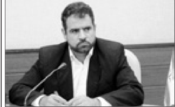
معاون ورزش و جوانان قم؛

اعتبارات هیئت‌های ورزشی از یک تیم لیگ برتر نشی تفریحی غیر فوتبال هم کمتر است گفت: اعتبارات هیئت‌های ورزشی قم هدفمند تخصیص داده می‌شود.