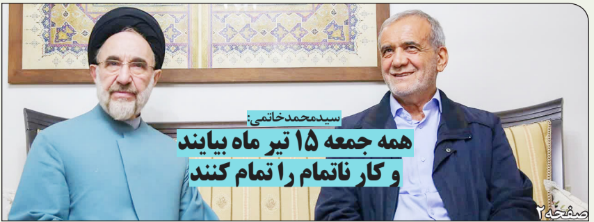
سیدمحمدخاتمی همه جمعه ۱۵ تیر ماه بیایند و کار ناتمام را تمام کنند