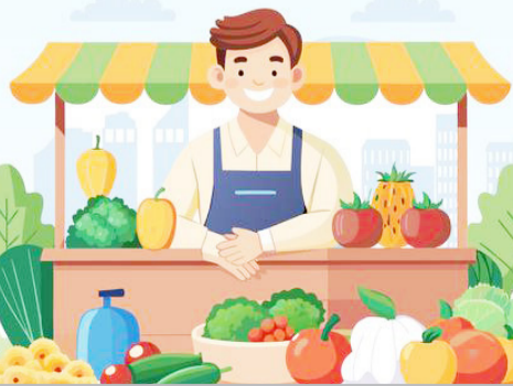
کالری بیشتر: میوه های میان