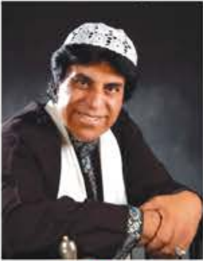
مدیر کل بهزیستی استان قم: